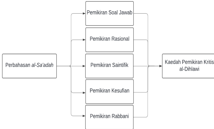
Rajah 2. Kaedah pemikiran kritis al-Dihlawi berdasarkan analisis perbahasan al-sa'adah