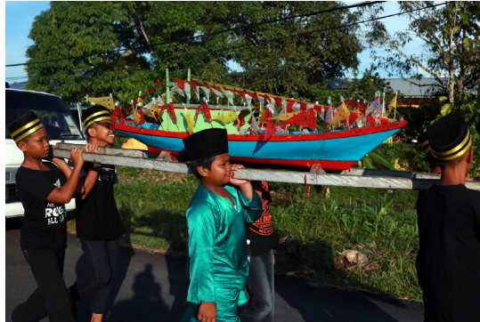
Rajah 3: Contoh jong diperarakan majlis khatam al-Quran.

hadiah kepada guru terus dihantar ke rumah tanpa mengikut perarakan, kekurangan tukang kayu yang pakar dalam menghasilkan jong dan kos penghasilan yang tinggi. Penghasilan jong melibatkan kos yang tinggi sekiranya pemilik memilih kayu/papan yang baik dan tahan lama. Pak Sudin turut menyatakan bahawa kos penghasilan setiap jong adalah lebih kurang RM500 hingga RM1,000 bergantung pada material yang digunakan.