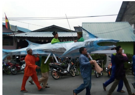
Rajah 4: Usungan yang berbentuk sampan (kiri) dan ikan yu (kanan).