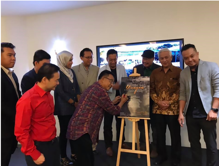
Rajah 10: Majlis perasmian pameran Usungan: A Presentation of Innovation and Artistic Creation in Bonded Community, Kabong, 2019 .

Usaha membawa dan menetengahkan amalan usungan ke ruang galeri mengangkat martabat amalan ini dan meningkatkan kesedaran dalam kalangan komuniti bandar. Hasil daripada pameran ini didapati bukan hanya masyarakat semenanjung yang kurang sedar kewujudan budaya ini, malah penduduk sekitar Kuching juga baharu menyedari akan wujudnya amalan unik sebegini. Datuk Abdul Karim Rahman Hamzah (2019a) menyatakan bahawa amalan ini telah wujud sejak sekian lama di Sarawak namun baharu kali ini beliau melihat ada usaha untuk memperkenalkan, menaikkan dan mendokumentasikan amalan usungan/tandu ini. Tambah beliau lagi, usaha sebegini amat penting agar budaya dan seni yang ada daripada pelbagai kaum dan etnik di Sarawak dapat dipelihara serta menjadi warisan kepada generasi masa hadapan. Pameran ini juga telah menjadi titik tolak kepada penyelidik dan penggiat yang memperjuangkan dan mengangkat budaya setempat apabila Datuk Abdul Karim Abdul Rahman Hamzah menyatakan yang beliau akan terus komited memberi peruntukan kepada institusi pengajian tinggi (IPT) yang berminat dalam menjalankan penyelidikan seni dan budaya berkaitan Sarawak.