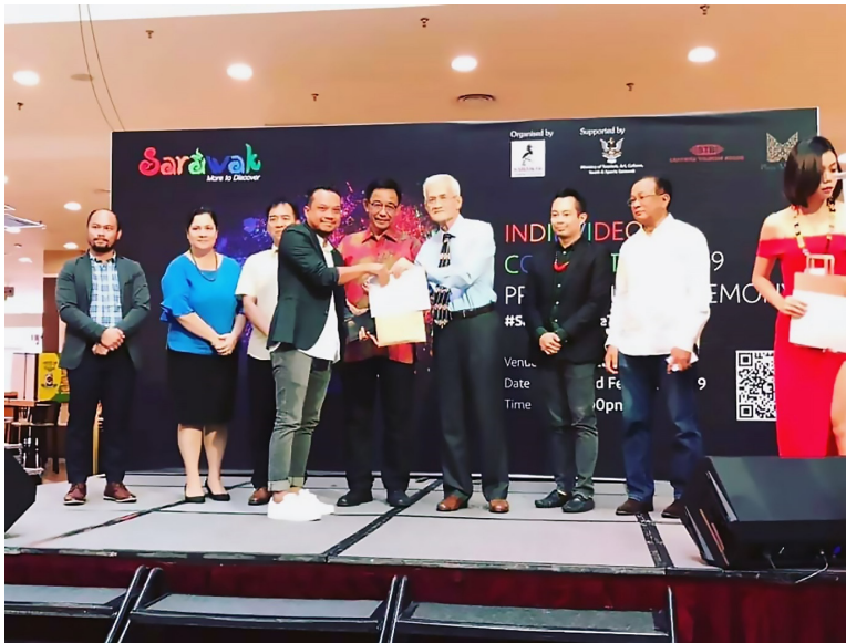
Rajah 11: Majlis penyampaian hadiah pertandingan “Sarawak More to Discover Indie Video Competition 2019”.

(Rajah 11). Dua penyelidik juga telah berjaya ke peringkat akhir pertandingan serta pameran Bakat Muda Sezaman 2019 yang telah diadakan bermula April hingga September 2019. Pertandingan dan pameran ini dianjurkan oleh Balai Seni Negara dengan tujuan mencari bakat seniman muda baharu dan subjek-subjek terkini. Penyertaan dua penyelidik ini dalam Bakat Muda Sezaman 2019 mempunyai objektif yang sama iaitu memperkenalkan dan memartabatkan amalan usungan ke ruang kontemporari galeri bersifat kebangsaan. Hasil daripada pameran dan pertandingan ini, amalan usungan telah diperkenalkan seterusnya didokumentasikan dan diterbitkan menjadi satu bab dalam buku terbitan Balai Seni Negara. Jelas sekali, penerimaan komuniti luar mahupun bandar terhadap amalan usungan ini sangat memberangsangkan. Justeru, amalan ini sedikit sebanyak telah dikenali dan ditunggu-tunggu pelaksanaannya setiap tahun di Sarawak.