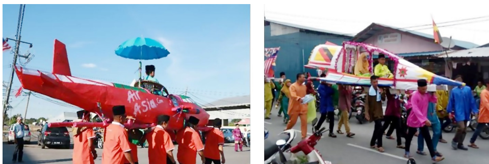
Rajah 5: Usungan yang berbentuk kapal terbang (kiri, 2018) dan jet pejuang (kanan, 2017).

Namun, aspek kreativiti dan imaginasi turut tidak ketinggalan dalam penghasilan usungan ini. Kreativiti dan imaginasi ini tercetus apabila si cilik yang diraikan di atas usungan mempunyai kesempatan untuk membuat permintaan ke atas rekaan yang akan dihasilkan. Rekaan berbentuk kapal terbang seperti Rajah 5 (kiri) ialah permintaan kanak-kanak yang bercita-cita menjadi juruterbang. Begitu juga dengan rekaan jet pejuang seperti Rajah 5 (kanan). Ia merupakan permintaan yang membawa kepada refleksi cita-cita kanak-kanak tersebut yang ingin menjadi tentera udara. Ibu bapa dan ahli keluarga akan berusaha menghasilkan usungan berbentuk kapal terbang dan jet pejuang bagi memenuhi permintaan anak-anak mereka. Beberapa lakaran usungan dihasilkan semasa kajian lapangan berdasarkan kepada subjek atau imej yang diinginkan oleh peserta perarakan. Lakaran tersebut diterjemahkan oleh ibu bapa dan keluarga kepada objek sebenar usungan dalam bentuk 3 dimensi. Lakaran ini menggambarkan kreativiti, inovasi dan imaginasi masyarakat pesisir ini.