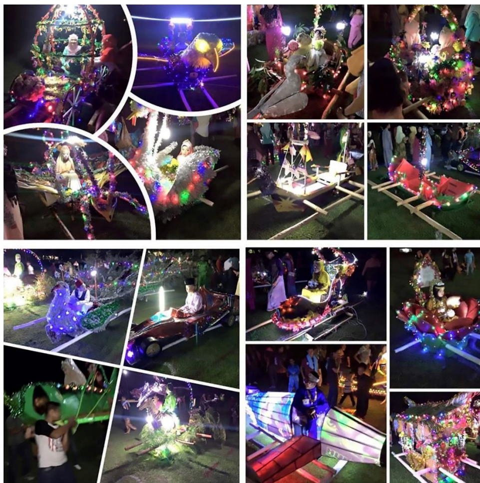
Rajah 9: Jenis usungan/tandu di kawasan Bintulu.