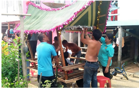
Rajah 2: Perarakan usungan diiringi dengan paluan kompang dan hadrah (kiri) serta gotong-royong menghasilkan usungan (kanan).