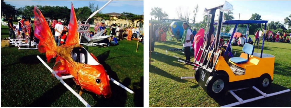
Rajah 8: Contoh jenis-jenis usungan/tandu di kawasan Belawai, Tanjung Manis.

Berbeza pula di kawasan Bintulu, amalan ini telah mengalami perubahan dari aspek pelaksanaan dan rekaan. Perarakan usungan/tandu ini diadakan pada sebelah malam kerana rekaannya dihasilkan dengan menggunakan diod pemancar cahaya untuk memberikan kesan cahaya dan membuatkan perarakan ini tampak sangat meriah, terang benderang dan berwarna-warni oleh diod pemancar cahaya yang didatangkan dengan pelbagai warna. Terdapat sedikit perbezaan di Bintulu kerana amalan ini diadakan pada waktu malam dan konsep rekaan pula mempunyai sentuhan moden (Rajah 9).