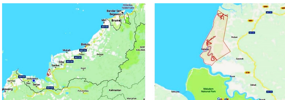
Rajah 1: Peta Kabong, Sarawak.