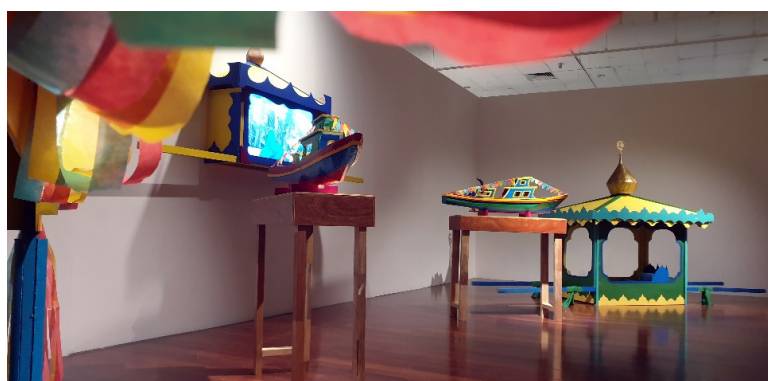
Rajah 12: The Parade of the Usungan di Pertandingan Bakat Muda Sezaman 2019.