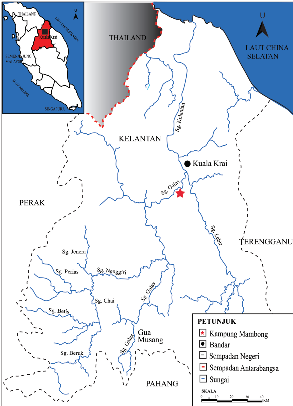
Rajah 1: Lokasi Kampung Mambong di Sungai Galas, Kuala Krai, Kelantan.