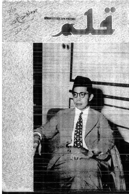
Rajah 1: Kulit hadapan majalah Qalam