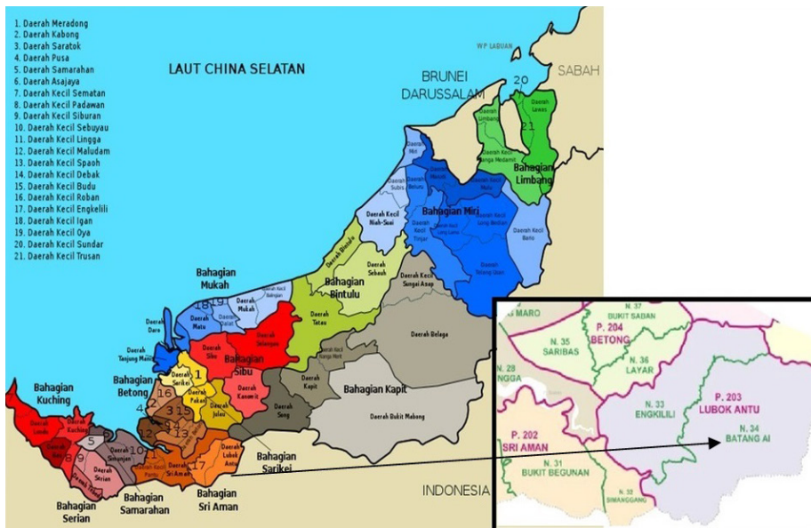
Rajah 1: Peta Batang Ai, Sarawak.

tuan tanah ini terserlah apabila masyarakat tani terpaksa meminta perlindungan keselamatan daripada ancaman atau musuh. Pada masa tersebut, masyarakat tani selalu menerima ancaman dan gangguan daripada musuh dan perompak. Bukan sekadar itu, masyarakat tani juga menghadapi masalah pengeluaran pertanian yang merudum dan tidak berdaya ekonomi. Keadaan ini menyebabkan masyarakat tani memerlukan bantuan daripada pihak yang berstatus ekonomi lebih tinggi iaitu kumpulan tuan tanah. Sebagai balasan kepada perlindungan dan bantuan yang diberikan oleh tuan tanah, petani-petani miskin ini akan mengerjakan tanah pertanian tuan tanah tersebut. Maka, hubungan penaung-dinaungi bermula di sini. Hubungan ini berkait rapat dengan kebergantungan kepada pihak yang lebih tinggi statusnya. Kesemua penjelasan tersebut merupakan takrifan penaungan dalam konteks antropologi yang menggambarkan bahawa penaung-dinaungi ialah hubungan timbal balas antara dua pihak yang tidak mempunyai status yang sama. Penaung-dinaungi ini saling memerlukan antara satu dengan yang lain. Hal ini bermakna, konsep penaungan ini telah lama wujud dalam masyarakat di dunia seperti di Eropah, benua Afrika dan di rantau Asia seperti di Jepun. Inilah asas kepada konsep politik penaungan yang melibatkan timbal balas antara satu pihak dengan pihak yang lebih tinggi statusnya.