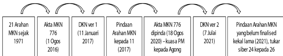
Rajah 3: Carta alir penggubalan Dasar, Arahan dan Akta MKN.

Pada Disember 2015, Rang Undang-Undang MKN 2015 telah dibentangkan dan diluluskan di Parlimen. Seterusnya, pada Julai 2016, Akta MKN 2016 telah diwartakan. Pada 1 Ogos 2016, Akta MKN 2016 dikuatkuasakan sebagai satu akta utama yang memayungi kesemua 21 Arahan MKN tersebut. MKN turut mengeluarkan Dasar Keselamatan Negara pada tahun 2017 dan diperbaharu semula pada tahun 2021 sebagai panduan dan rujukan utama kementerian/agensi persekutuan dan negeri dalam penggubalan/semakan dasar-dasar sedia ada bagi mengurus dan menghadapi ancaman keselamatan negara yang semakin dinamik dan kompleks. Carta alir penggubalan dasar, arahan dan akta MKN seperti Rajah 3.