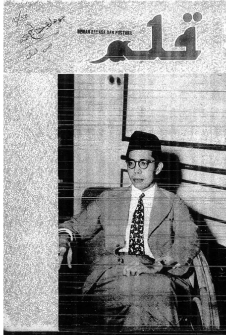
Rajah 1: Kulit Hadapan Majalah Qalam Sumber: Qalam, bil. 3, Oktober 1950.