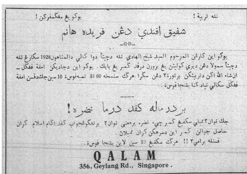
Rajah 4: Penjualan gambar Nadrah diiklankan dalam majalah Qalam dan hasil jualannya disalurkan ke dalam tabung berkenaan

menjual gambar Nadrah. Penjualan gambar Nadrah diiklankan dalam majalah Qalam dan hasil jualannya disalurkan ke dalam tabung berkenaan (Qalam, Januari 1951). Namun, Dato' Onn Jaafar mengambil keputusan untuk tidak melibatkan UMNO dalam kes tersebut. Beliau merayu kepada semua bahagian dan cawangan UMNO supaya menghentikan segera semua tindakan yang dilakukan terhadap kes rayuan Nadrah (CO 537/7302). Dato' Onn menganggap perkara tersebut bukan perkara yang melibatkan bangsa atau agama sebaliknya hanya kes perbicaraan merebut hak penjagaan. Atas pendirian Dato' Onn dan UMNO ini, Ahmad Luthfi menganggap UMNO telah lari dari matlamat asal penubuhannya iaitu penyatuan Melayu berlandaskan agama dan bangsa. UMNO tidak lagi dapat diharapkan membela agama kerana perjuangan nasionalisme yang didasarkan oleh UMNO adalah nasionalisme yang sempit bukannya perjuangan nasionalisme yang diajarkan oleh Islam iaitu perjuangan untuk mencapai gagasan kedaulatan bangsa melalui Islam dan berusaha mengukuhkan keimanan kepada Allah s.w.t. melalui konsep ummah (Qalam Disember 1950: Warta Negara 28 Ogos 1950). Ahmad Luthfi lantang mengkritik kepimpinan Dato Onn sebagai seorang pemimpin yang memisahkan Islam daripada politik dan memecahkan ikatan persaudaraan Islam (Qalam Mac 1951).