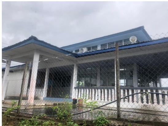
Gambar 1: Masjid al-Muwafaqoh di Kampung Pomonsukan Matunggong Terkini