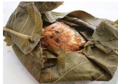
Rajah 1: Makanan tradisional Lenggong, ikan masak pindang daun seniah