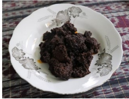
Rajah 5: Masakan istimewa masyarakat Lenggong iaitu rendang daging masak hitam

Majoriti makanan didominasi oleh suku kaum Melayu berketurunan Pattani, tetapi makanan ini diterima dan diadaptasi oleh semua masyarakat Lenggong dari suku kaum lain yang sudah tinggal lama di sini. Pembudayaan makanan ini dianggap satu simbol kesepakatan bagi masyarakat di situ. Informan 8 menyatakan bahawa: