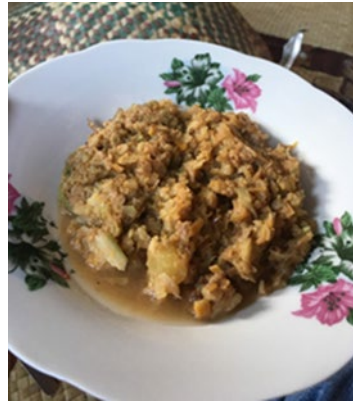
Rajah 3: Kebebe sebagai makanan tradisional masyarakat Lenggong

Masyarakat Lenggong mengumpulkan hasil tumbuhan yang berada di sekeliling sebagai sebahagian daripada bahan masakan. Mereka juga menjalankan aktiviti bercucuk tanam seperti menanam kelapa, serai, daun pandan, dan buah-buah tempatan di kawasan sekeliling rumah. Ada juga tumbuhan yang tumbuh secara semulajadi yang digunakan di dalam masakan. Menurut informan 6, di sini terdapat ulam-ulam yang ada di kawasan persekitaran dan tumbuh liar di tepi sungai seperti daun pegaga dan putat yang digunakan sebagai ulam atau dibuat nasi ulam. Informan 6 menyatakan bahawa: