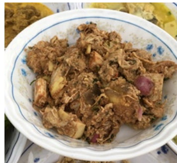
Rajah 2: Umbut bayas yang dibuat sebagai kerabu umbut bayas

Kebebe (Rajah 3) merupakan salah satu makanan tradisional Lenggong yang dibuat daripada buah-buahan yang diperolehi dari hutan dan sekeliling kawasan rumah. Buah-buahan seperti buah kelompong, cedong dan buah ara yang diperolehi di dalam hutan dikutip dan dijadikan hidangan tradisi Lenggong iaitu kebebe. Informan 4 menyatakan bahawa: