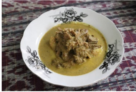
Rajah 4: Daging masak patani antara makanan tradisional masyarakat Lenggong

Kebebe juga merupakan makanan tradisional Lenggong yang berasal dari suku Melayu Pattani. Menurut informan 5, makanan ini disediakan sewaktu gotong-royong beramai-ramai menumbuk kerisik dalam satu majlis perkahwinan sewaktu zaman dahulu. Informan 5 menyatakan bahawa: